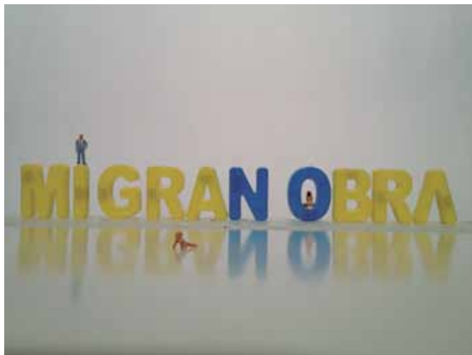
© DAVID ESPINOSA/EL LOCAL ESPACIO DE CREACIÓ

DATA: DS, 6 D'OCTUBRE HORA: 16:00H/18:00H/20:00H ESPai: NOVA JAZZ CAVA DURADA: 50' PREU: 3€ ESPECTACLE EN CASTELLÀ COPRODUCCIÓ